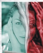
Тебе оно надо?