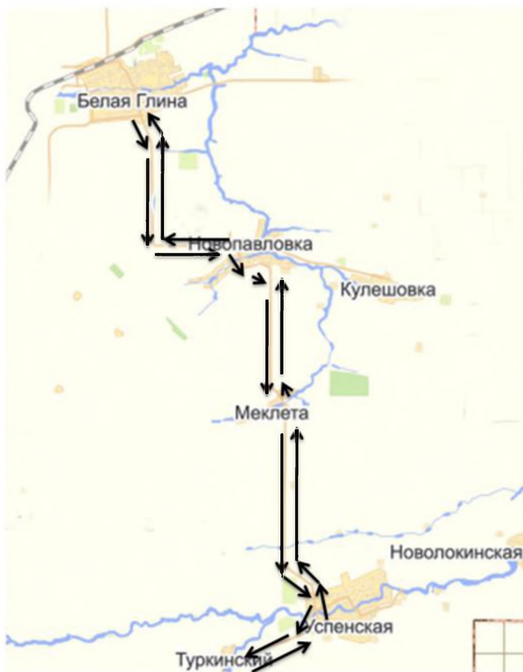
Схема маршрута движения специального транспортного средства составляется с учетом рекомендаций к составлению схемы маршрута движения автобуса образовательного учреждения.

Схема подвоза учеников и организаторов на ЕГЭ